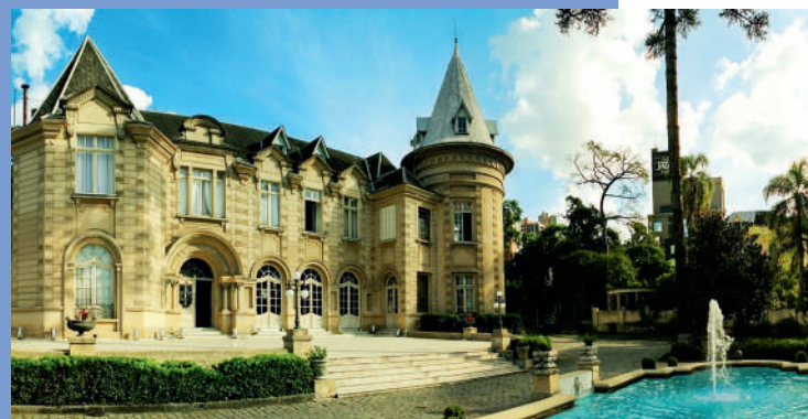
ÁREA EXTERNA DO CASTELO DO BATEL, EM CURITIBA