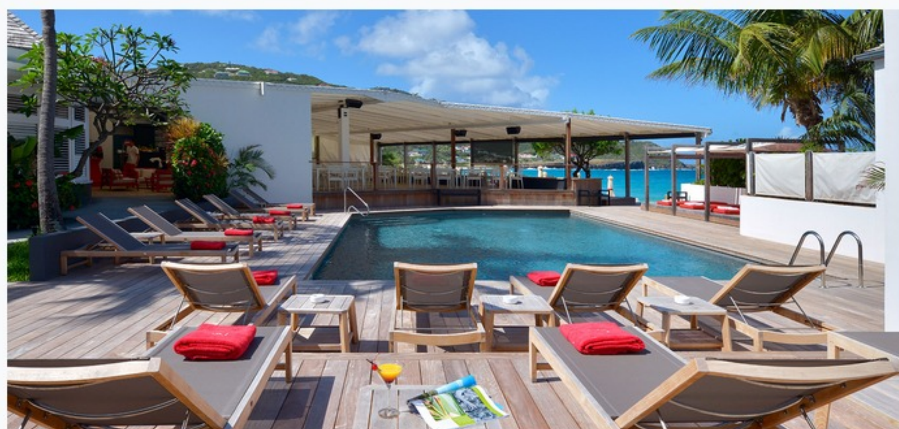
O charmoso hotel Taiwana é ótimo para casamentos

Charmosa, rústica, selvagem, encantadora e com uma natureza incrível. St. Barth é uma ilha perdida na imensidão do Caribe, ponto de encontro do jet set internacional e o local ideal para realizar seu casamento na companhia da família e de amigos mais próximos, caso queira convidar em torno de cem pessoas. Os fornecedores e designers florais locais sabem como ninguém fazer o seu ofício e conhecem muito bem a ilha. Dessa forma, eles podem tornar seu dia especial impecável. Em todos os sentidos. Criar o momento perfeito para os convidados, que têm uma alta expectativa para uma cerimônia de casamento em uma ilha tropical, leva meses de trabalho. Afinal, este dia tem que ser o melhor em todos os sentidos: as flores devem ser as mais frescas, a comida a mais sofisticada e deliciosa e o serviço, sem dúvida alguma, o mais personalizado. Para tudo isso acontecer de forma ideal, visitei diversos locais na ilha e fiz as minhas escolhas: