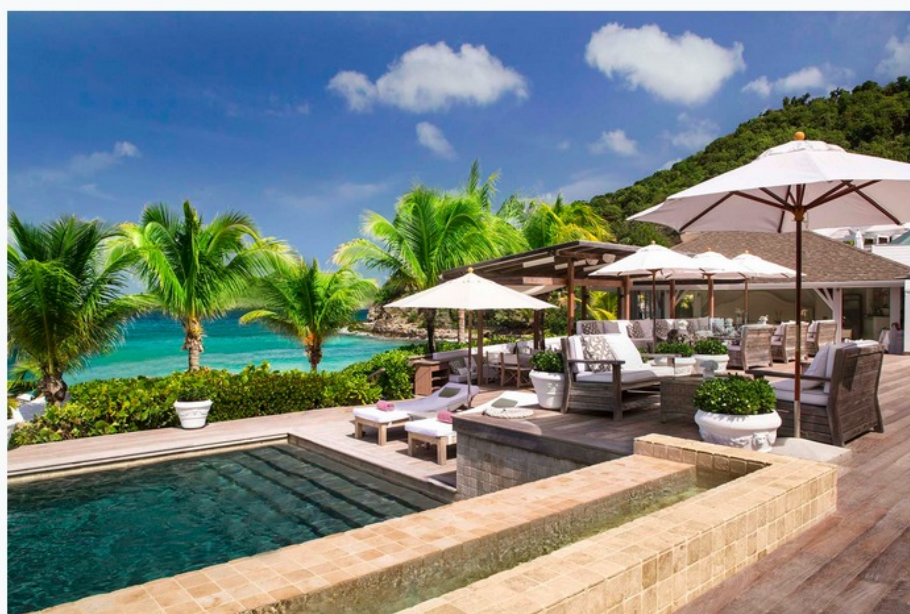
O hotel La Isle de France tem a bandeira Louis Vuitton

A praia de Flamands passou a ser a nova "Gold Coast" de St. Barth, fama obtida graças à sua bela praia de areia branca e água cristalina. Acrescente o luxo de dois hotéis de classe mundial, restaurantes chiquérrimos e várias opções de vilas. Assim fica fácil entender por que a praia é uma das favoritas, não? Os hotéis Taiwana e Isle de France, este tem a bandeira Louis Vuitton, oferecem quartos, bangalôs e suítes no extremo leste da praia. Seus restaurantes são reservados ao longo da alta temporada por visitantes de toda a ilha, bem como os hóspedes dos hotéis. Os hotéis são perfeitos para a realização de casamentos espetaculares e com o cenário ideal para deixar qualquer mortal de queixo caído.